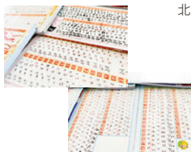
恒例のドリル3回チャレンジ