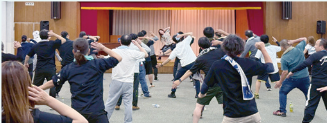
ZUMBAでいい汗を流しました!

第一部では、カイロプラクターの益子奈緒子氏を講師に、生活習慣の改善方法や経営者としてどのようにして健康に向