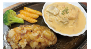
神戸ビーフハンバーグとカニクリームコロッケ