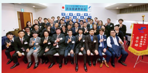
総会出席者による集合写真