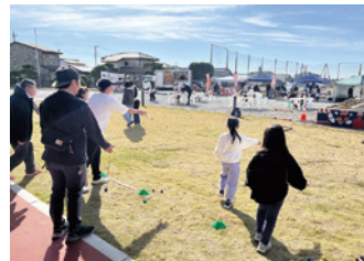
ラダーゲッター体験