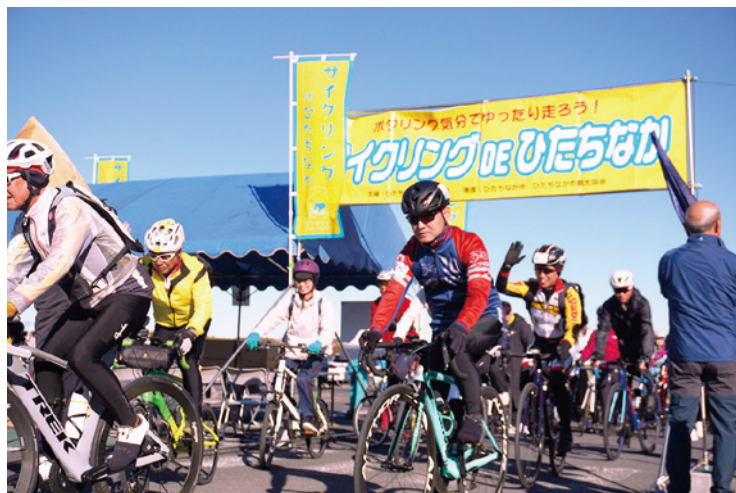
晴天の中、参加者がスタート！