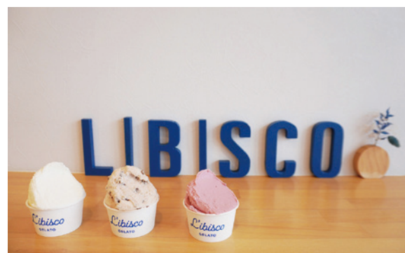
左：オブセ牛乳 真ん中：生チョコ 右：ラズベリー