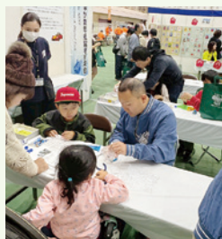
青研メンバーが丁寧にサポート!

の飲食店で提供する(株)マルベリー、日本最大級の規模のロケット発射台を有する種子島宇宙センター、そして知覧特攻平和会館を見学しました。日本の技術の粋、また地域活性化や持続可能性を目指す取り組みなどを学び、メンバーにとって大きな刺激になりました。