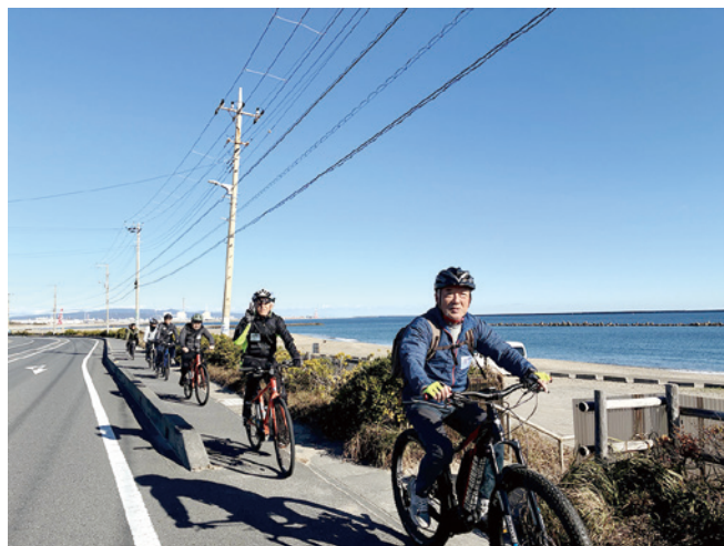
阿字ヶ浦海岸を快走中！