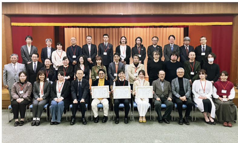
受講生から起業家の顔つきになりました