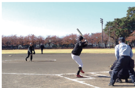
フェアプレーによる白熱した試合

建設業部会（横須賀靖部会長）は、部会間の親善交流を目的とした、親善ソフトボール大会を開催しました。5チーム約70名が木枯らしの