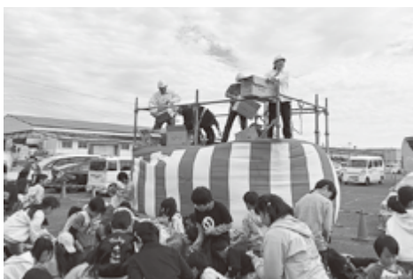
小学生限定ミニ上棟式