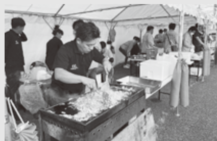
みなと産業祭の青年部出店ブース

青年部では、みなと産業祭(10/19)・産業交流フェア(11/1~2)に出店しました。今年も焼きそば、松茸ご飯、ポップコーン、わたあめなどを販売し、地域の賑わいづくりに貢献しました。(企業支援課 大沼)