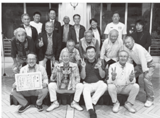
優勝に輝いた南部ブロックの皆さん

第21回ブロック対抗親善ゴルフ大会が10月8日、那珂湊ブロック主管で勝田ゴルフ倶楽部にて開催されました。当日は天候にも恵まれ、166名の参加者がブロックの枠を超え、親睦を深めることができました。