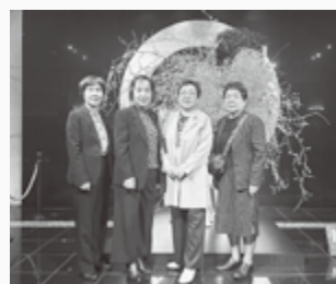
会場前で記念撮影!