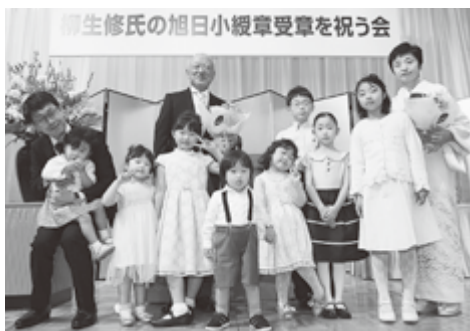
8人のお孫さんたちから ブーケのプレゼント