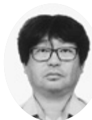
朝倉 誠 桐