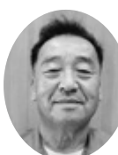
黒澤 英 雄