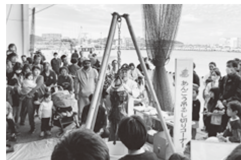
大人気！あんこうの吊るし切り