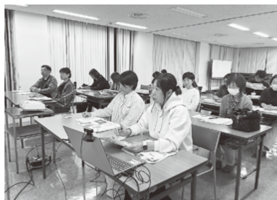
結果を発表してもらいました！

9月1日から30日まで開催した「まちゼミ」について、参加店舗の皆さんによる結果報告会を実施しました。期間中は延べ120名以上の方が受講し、アンケート結果から受講者の傾向や特徴などを分析しました。報告会では、各店舗から工夫した点や課題について発表が行われました。また、受講者が講座後お客様として来店するようになった店舗や、講座内容をそのまま有料化し事業展開につなげた事例も紹介されました。当日は講師からの助言もあり、次回のまちゼミに向けて有意義な意見交換の場となりました。