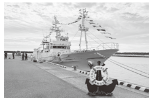
漁業調査指導船「いばらき丸」