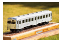
茨城交通ケハ601 1/24スケールモデル