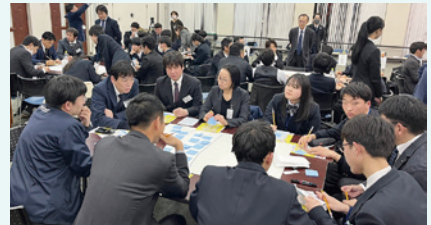
熱心なグループワーク