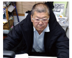
PCと向き合う月川社長