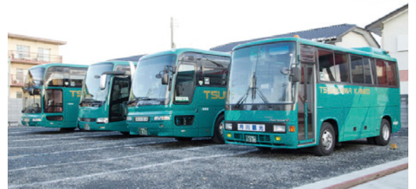
様々な種類のバスたち