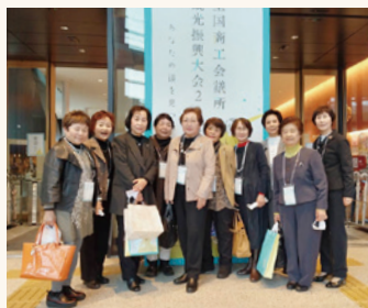
観光振興大会の会場にて