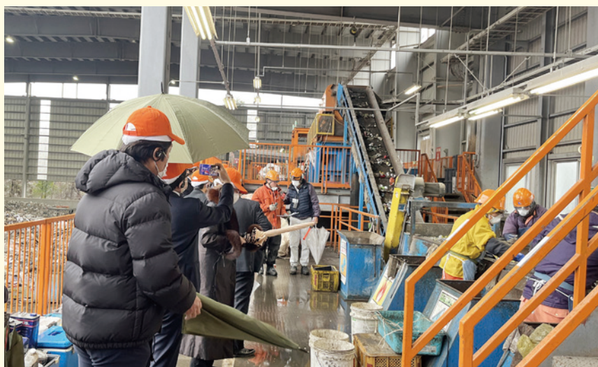
勝田環境グループ 選別作業の現場を見学!