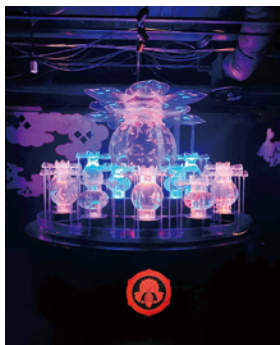
幻想的な アートアクアリウム美術館

5年ぶりの開催となった 会員親睦・共済還元事業。 45名が参加し、久しぶりの 交流を深めました。 今回のメインとなる視 察先は「アートアクアリ ウム美術館 GINZA」 で、無数の金 魚とアトス ティックな装 飾、音や香り を演出する幻