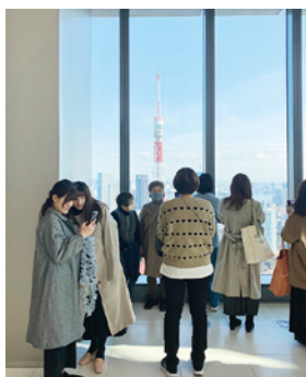
麻布台ヒルズ展望台から 東京タワーを眺める参加者たち

想的な風景を楽しむことが できました。 また、昨年11月に開業し たばかりの複合施設「麻布 台ヒルズ」は全高330m の日本一高い超高層ビルで、