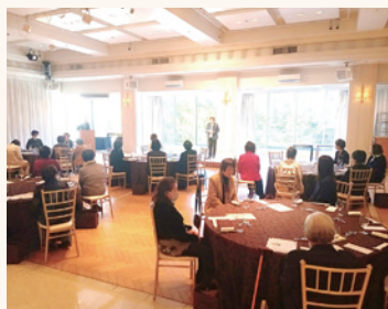
新年会で交流を深める