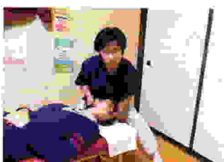
骨格の歪みを正しい位置に