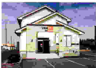
白い外壁が目印です