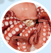
ひたちなか名物のほしいも&タコ