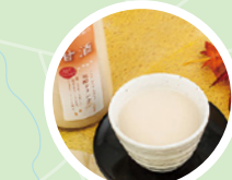
甘酒&シフォンケーキ