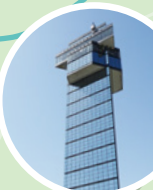
AS3 大洗マリンタワー